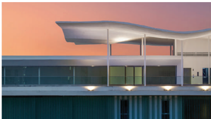
RIO DE JANEIRO ART MUSEUM - RIO DE JANEIRO - 2013