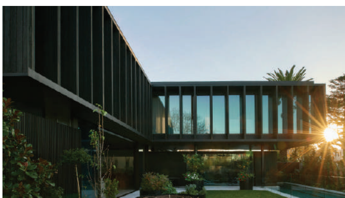
RESIDÊNCIA ANM - MELBOURNE, AUSTRÁLIA - 2019