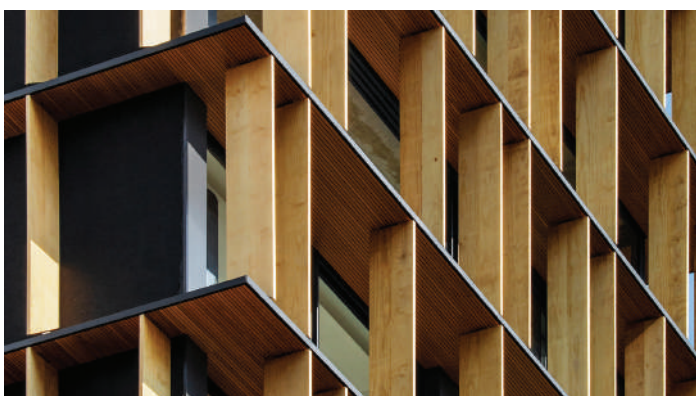
NUBE BUILDING - SÃO PAULO - 2021