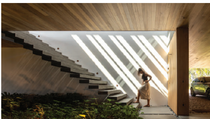
MS HOUSE, SÃO PAULO - 2019