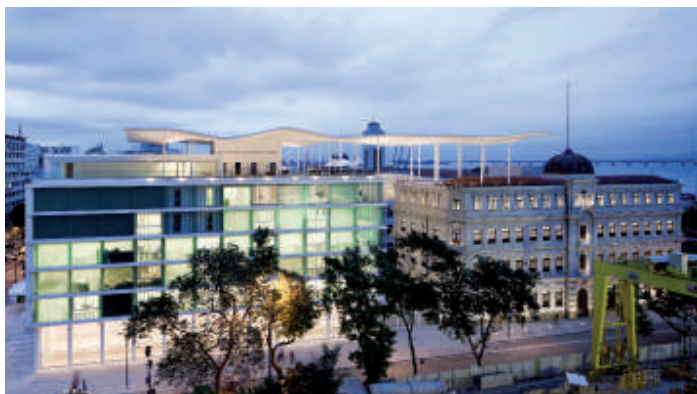
MUSEU DE ARTE DO RIO - RIO DE JANEIRO - 2013