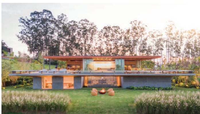
RESIDÊNCIA MS - SÃO PAULO - 2019